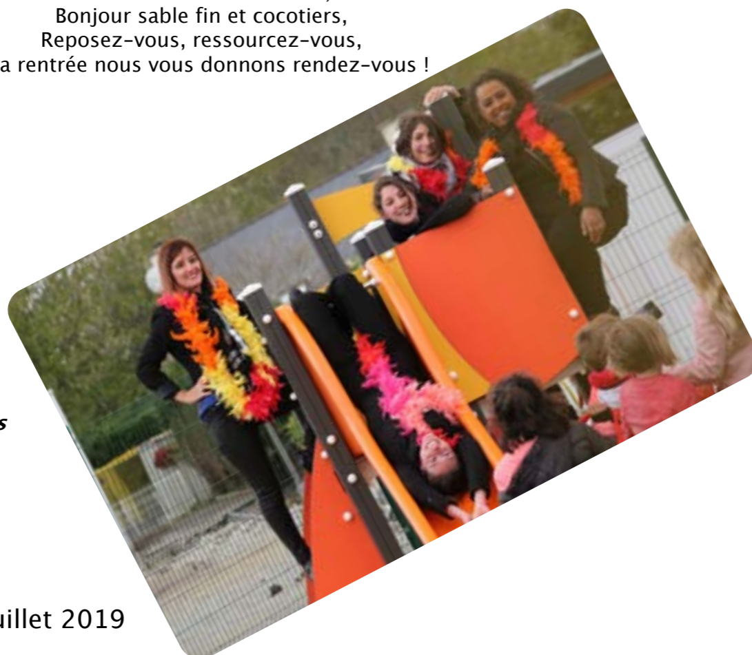
Les Drôles de Dames

Adieu cartables et cahiers, Bonjour sable fin et cocotiers, Reposez-vous, ressourcez-vous, A la rentrée nous vous donnons rendez-vous !