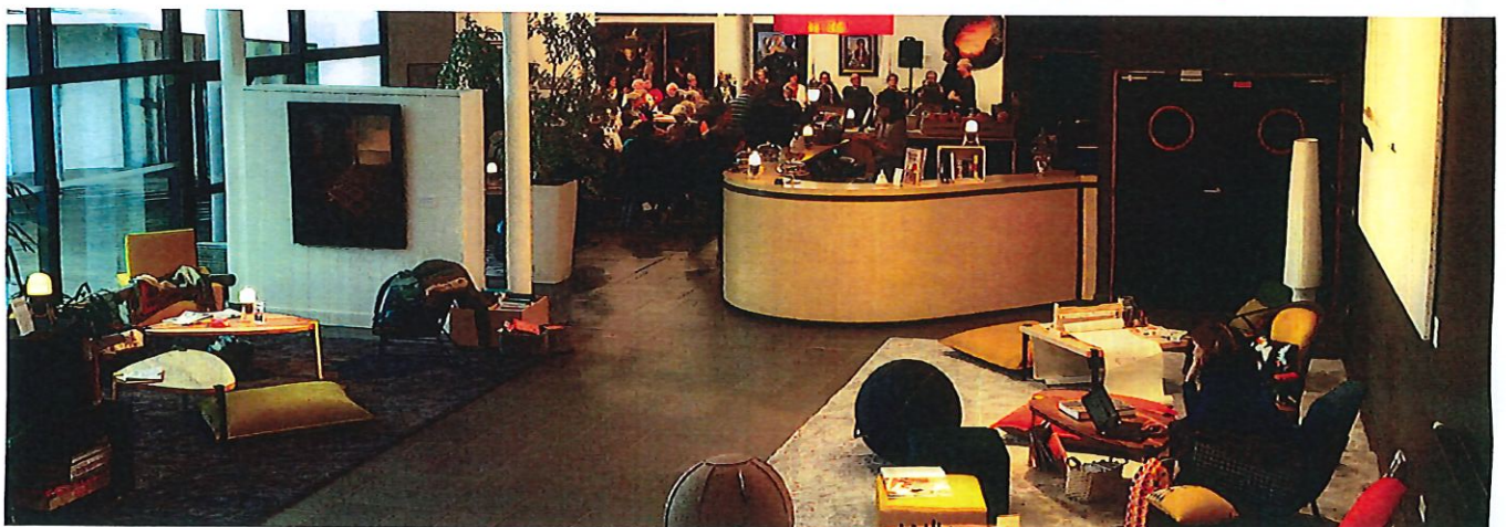
dans des lieux de convivialité.